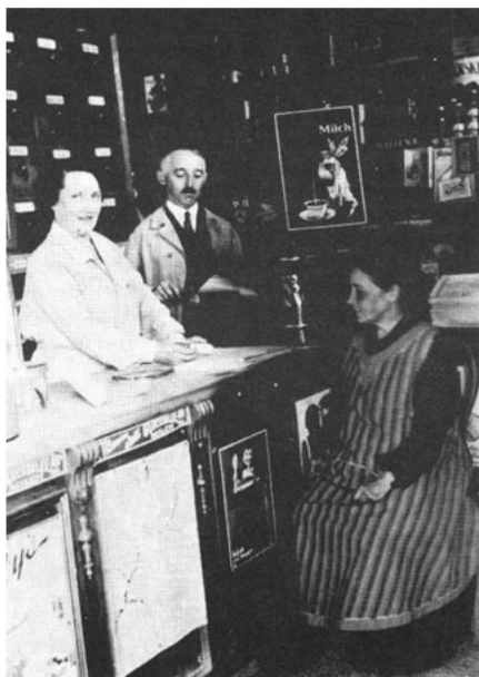
Alles für den täglichen Bedarf. Kolonialwarenläden wie diesen gab es damals mehrere in der Kochstraße.

Nähere Informationen über die Kochstraße und das Leben ihrer Bewohner gibt es im Geschichtskabinett im Freizeithaus Linden. Öffnungszeiten: montags 10 bis 12 Uhr und nach telefonischer Absprache unter 2 10 71 25 oder 1 68 4 01 84. Der Film „Wir aus der Kochstraße“ kann an der Informationskassette käuflich erworben werden.