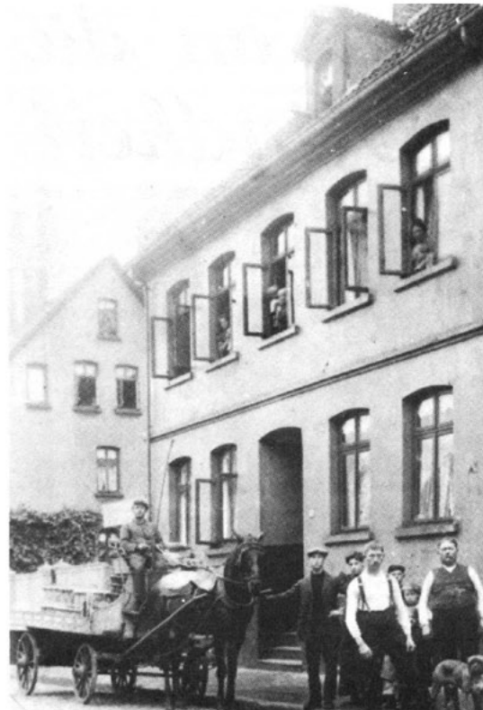
Der Fuhrmann ist da.