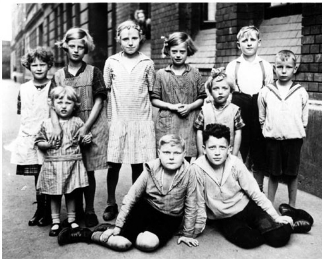
Als seien sie direkt der populären englischen Serie „Die kleinen Stroche“ entsprungen: die Kinder aus der Kochstraße Nr. 9.

Der Hof war reserviert für die Kleinen und die älteren Haus-