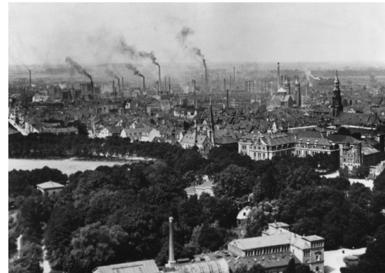
Luftbild vom Neuen Rathaus Hannover Richtung Linden

Im österreichischen Gräfenberg, einem kleinen beschaulichen Dorf mit nicht mehr als 20 Häusern, wird Vincenz Prießnitz am 4. Oktober 1799 geboren. Die Bewohner des Ortes ernähren sich vom Ackerbau, so auch Vincenz' Vater. Als dieser erblindet, muss der junge Vincenz in der Landwirtschaft seiner Eltern mithelfen und kann die Volksschule nur noch unregelmäßig besuchen. Dadurch lernt er weder richtig schreiben noch lesen. Seiner Umwelt aber fallen die großen Talente des kleinen Jungen auf: Scharfsinn, feine Beobachtungsgabe und ein vortreffliches Gedächtnis.