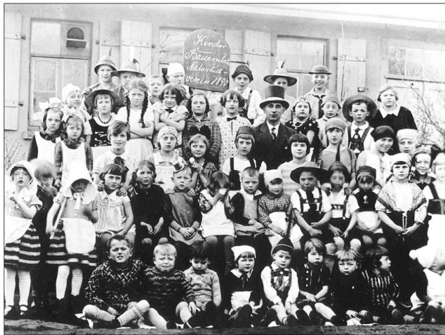
Der „Kinderbauernball“ gehörte zu den zahlreichen Veranstaltungen, die der Naturheilverein Prießnitz über lange Jahre auf seinem Gelände auf dem Lindener Berg durchführte.

Ende des 19. Jahrhunderts war Linden ein großer Industriestandort. Die Einwohner litten unter starker Umweltverschmutzung; Rauch und Ruß aus vielen Schloten vermischte sich mit beißenden Gerüchen aus Abfällen der Chemieindustrie. Dazu kam die Wohnsituation: kleine Wohnungen mit wenig Licht. Als im Jahr 1890 der „Naturheilverein Linden und Umgebung“ gegründet wurde, trugen sich 110 Mitglieder ein. Auf dem Lindener Berg pachtete der Naturheilverein ein großes Gelände, auf dem die Mitglieder dem grauen Lebensalltag entfliehen und in frischer sauberer Luft den herrlichen Blick über die Landschaft genießen konnten. Immer mehr Lindener entschlossen sich nun für eine Mitgliedschaft, im Jahr 1900 zählte der Verein mit über 1.000 Mitgliedern zu den 10 größten Naturheilvereinen im Deutschen Kaiserreich. Er trug nun den Beinamen „Prießnitz“, benannt nach einem sehr erfolgreichen Naturheiler. Neben Erholung standen auch Vorträge über Gesundheitspflege und naturgemäße Heilweise im Vordergrund und es gab naturheilkundliche Anwendungen.