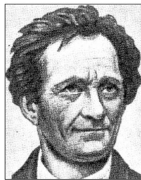
Vincenz Prießnitz (1799-1851)

Im österreichischen Gräfenberg, einem kleinen beschaulichen Dorf mit nicht mehr als 20 Häusern, wird Vincenz Prießnitz am 4. Oktober 1799 geboren. Die Bewohner des Ortes ernähren sich vom Ackerbau, so auch Vincenz' Vater. Als dieser erblindet, muss der junge Vincenz in der Landwirtschaft seiner Eltern mithelfen und kann die Volksschule nur noch unregelmäßig besuchen. Dadurch lernt er weder richtig schreiben noch lesen. Seiner Umwelt aber fallen die großen Talente des kleinen Jungen auf: Scharfsinn, feine Beobachtungsgabe und ein vortreffliches Gedächtnis.