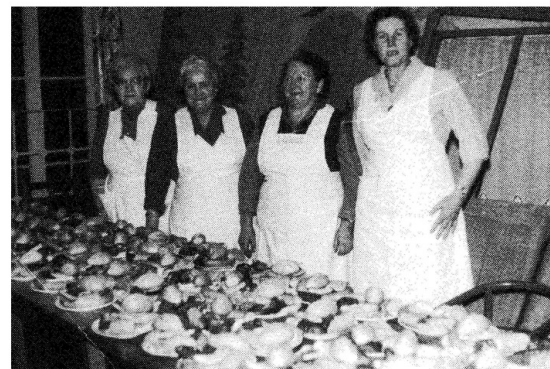
Eine der vielen Aktivitäten bei Prießnitz: Wurstessen in den 60er Jahren

durch kaltes Duschen verordnet Prießnitz je nach Krankheitssymptom auch kalte Kompressen, Bewegung, Trink- oder Schwitzkuren und spezielle Diäten (Wasser, Milch und kalte, ungewürzte Speisen). Mit seiner Kuranstalt erreicht Prießnitz weltweit einen guten Ruf. Kranke kommen sogar aus Asien und Amerika, um sich behandeln zu lassen. Auch der Dichter Nikolai Gogol und der Pianist Frédéric Chopin gehören zu seinen Patienten. Für seine Leistungen erhält Vincenz Prießnitz 1846 im Namen des österreichischen Kaisers die große goldene Verdienstmedaille. Prießnitz stirbt am 28. November 1851 an Lungentuberkulose. Sein Schaffen hat ihn überlebt: noch heute lassen sich Kranke in der von Prießnitz gegründeten Kuranstalt in Bad Gräfenberg (Láznú Jeseník) behandeln. tb